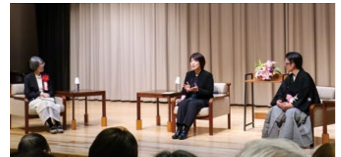
▲歴史小説の魅力や創作の舞台裏などが語られました