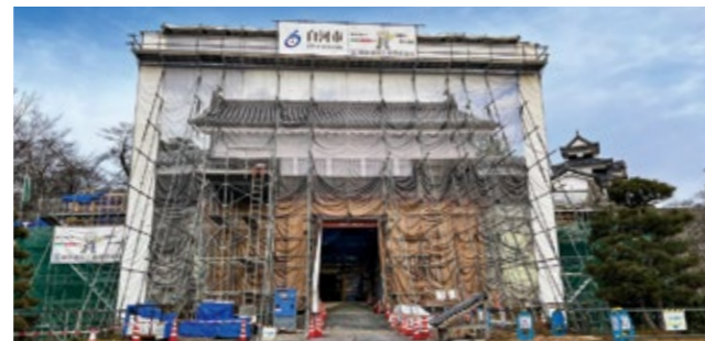
▲現場は完成イメージ（原寸大）のカバーで覆われています

11月30日、現在行われている小峰城清水門の復元工事現場の1階部分が一般に公開されました。来場者は、絵図や発掘調査に基づき往時の姿に忠実に再現される清水門の様子を見学し、幅1mもの太い柱に驚いたり、精巧に組まれた木組みの構造に見入ったりしていました。