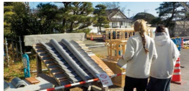
▲清水門の屋根の構造や骨組みがわかる模型も展示されました