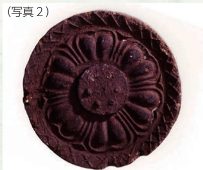
▲借宿廃寺跡出土復弁六葉蓮華文軒丸瓦（県指定文化財）

跡が確認されており、そこから多数の瓦が出土しました。軒先を飾る軒丸瓦には、蓮華の花の文様が使われています（写真2）。同じ文様の瓦が、阿武隈川を挟んだ、泉崎村にある関和久官衙遺跡から出土しています。関和久官衙遺跡は、古代白河郡の役所の跡とみられ、同時期に借宿の寺院も建立されたため、同じ瓦が使われたと考えられます。当時の最先端の技術である瓦葺き建築の技術が白河にもたらされたことから、政治の中心地であった飛鳥地方から重要な場所と考えられていた状況をうかがい知ることができます。