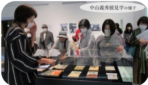
中山義秀展見学の様子