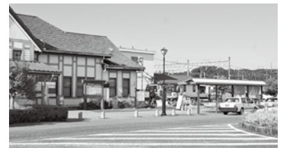
白河駅舎の東側に観光ステーションができます。

A | 大きさも限られていることから、観光情報の発信を主としながら、季節や祭りなどをテーマに市内各地域の銘品・製品の展示・販売を行い、それぞれの店舗に足を運んでもらう仕組みづくりを考えている。