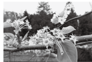
霜の被害を受けた梨の花 (本沼地内)

A | とうそうがい 凍霜害により例年以上に対応が必要となった作業や資材等に対して支援を行うものである。また、災害への備えとして、収入保険や農業共済の制度周知について共済組合や農協と連携し、農業者向け研修会等を通じて支援していく。