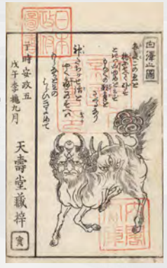
「白澤の図」『安政簡勞痢流行記』より

江戸時代の流行り病への対処は、必ずしも医学に基づいたものではありませんでした。さまざまな対策により、流行り病を乗り越えようとしていました。