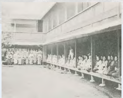
▲大塚本院の女室『養育院六十年史』より （東京都立中央図書館所蔵）