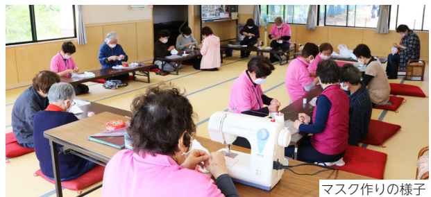
マスク作りの様子

皆で仲良く和気あいあいと活動しています。物作りを多く取り入れ、楽しく脳を活性化しています。ぜひ一度参加してください。