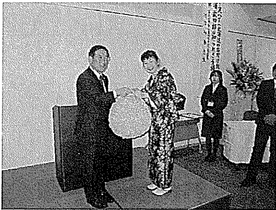
2/1 中山義秀文学賞贈呈式・受賞記念講演会