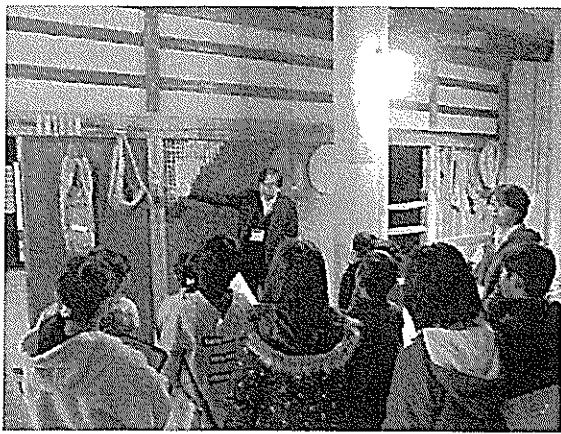
1/29 信夫第一小学校3年生見学学習