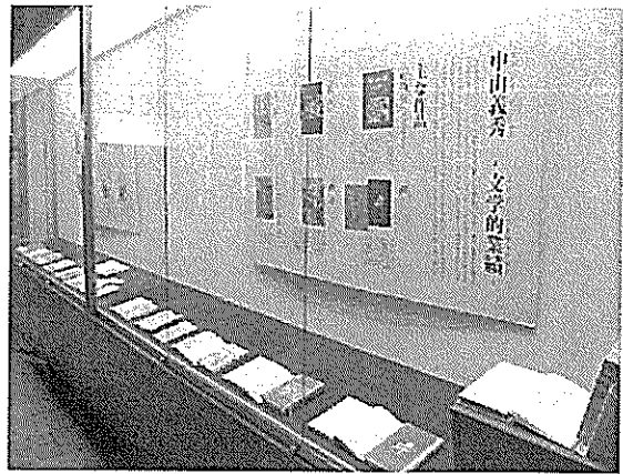
1/31~3/22 テーマ展「中山義秀文学的業績」