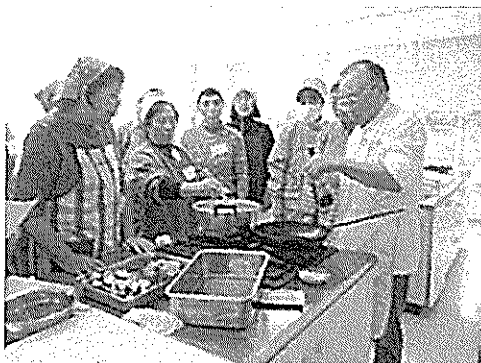
1. 1/21 わいわい家庭科教室