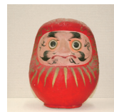
白河だるま (昭和36年) 〈歴史民俗資料館蔵〉