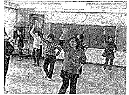
1. 2/15 楽しく体験生き生き講座