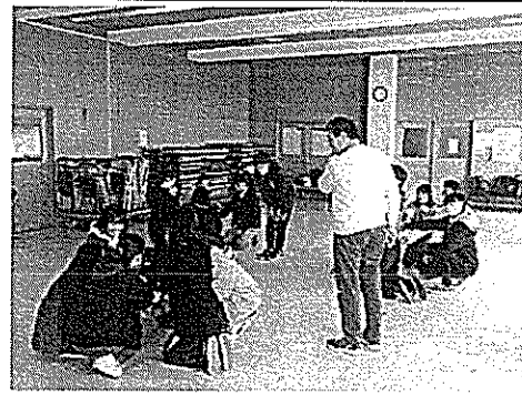
3/9 高校生ボランティアセミナー