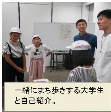
一緒にまち歩きする大学生と自己紹介。