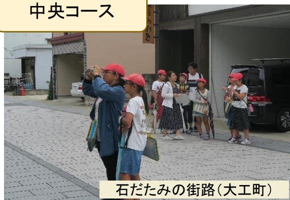
石だたみの街路(大工町)

市立図書館からコミネスへ向かい中町、 大工町、小峰通りを南下して、谷津田川 へと進むコースです。