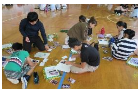
個人のノートをまとめていきます