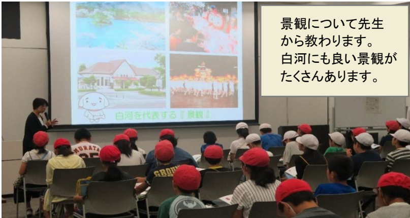
景観について先生から教わります。白河にも良い景観がたくさんあります。