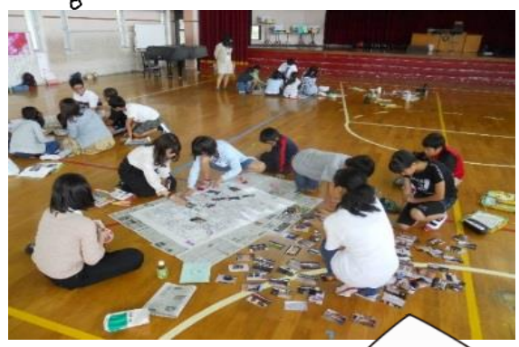
みんなの意見をまとめて大きなレポートを作成します