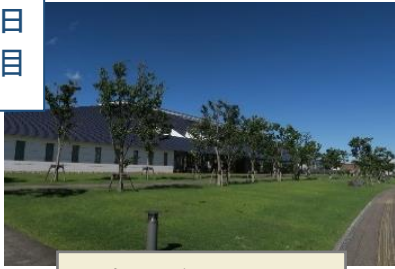
会場となったのは市立図書館です。