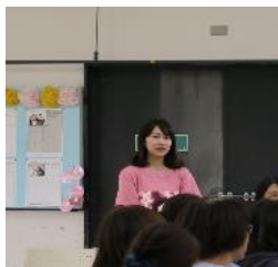
サポートした大学生