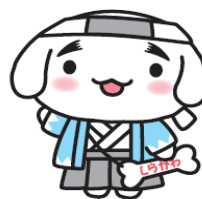
新撰組しらかわん

景観計画は、それらの景観資源を守り、つくり、育てることで、将来に向けて美しい景観を築くために必要な目標や取り組みについて示したものです。