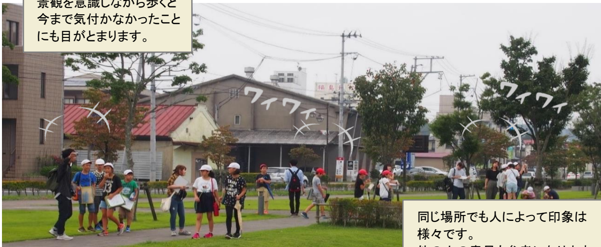
同じ場所でも人によって印象は様々です。他の人の意見も参考になります。