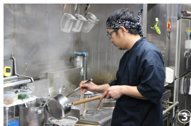
①女性にも人気の『チャーシューメン』 ②くせになる辛さが好評の『辛辣味噌ラーメン』 ③「より多くの人に満足してもらえよう、日々努力」と腕を振るう店主