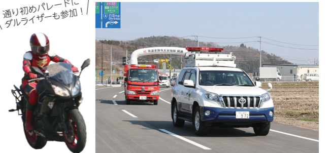
④地元の子どもたちも参加し、開通を祝いました