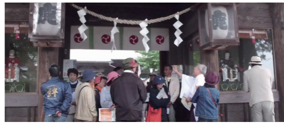
▲前回の様子（鹿嶋神社にて）

稲荷山など戊辰戦争にちなんだ場所を『白河大戦争』の作者とめぐるツアーを開催します。