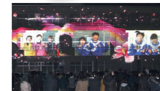
▲子どもたちの映像などが校舎に美しく映しだされました。

復興のシンボルである八重桜「はるか」に込められた想いを届けるため、2月2日、表郷中で「学校でプロジェクションマッピング！」が開催されました。当日はマッピングに関するミニ授業も行われました。