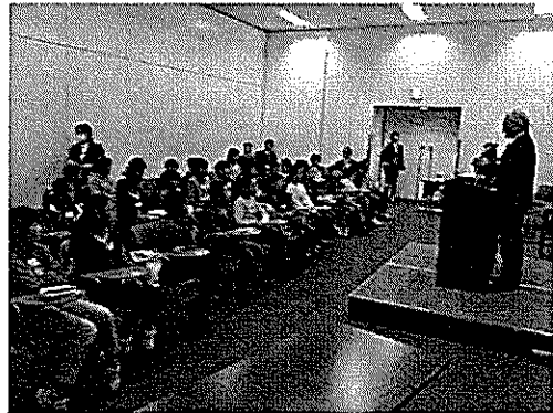
12/26 エンジョイイングリッシュ(4年生英語教室)