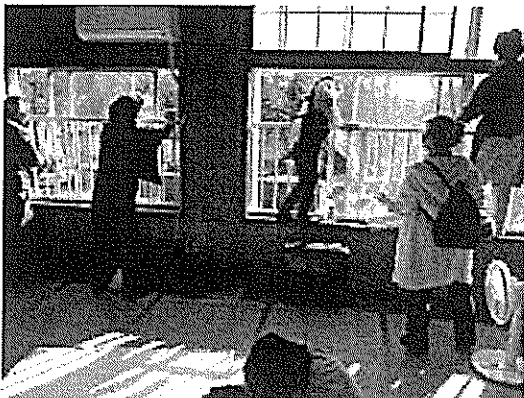
1. 12/22 大掃除