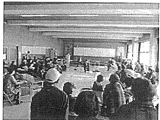
2. 12/22 AED 講習会