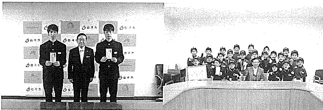
12/22 全国都道府県対抗中学 バレーボール大会出場激励金交付式