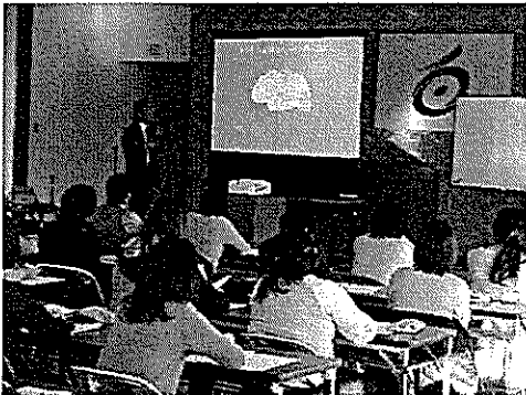
12/22 特別支援教育支援員研修