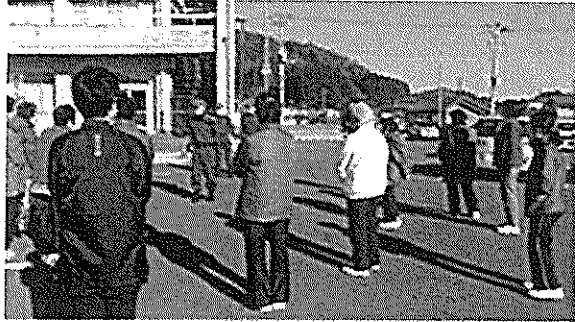
1. 12/22 消防訓練