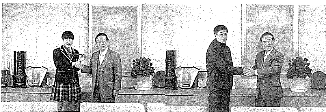
1/5 AFC U-19 女子選手権中国 2017 優勝報告