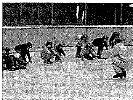
1. 12/27 ふるさと子ども体験塾