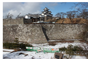
▲本丸北面修復工事の様子 ▲完了した竹之丸南面石垣