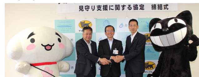
△ヤマト運輸(株)・ヤマトマルチメンテナンソリユーションズ(株)との協定締結の様子(6月16日)