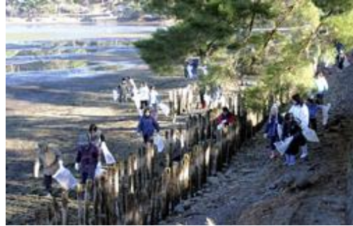
南湖清掃ボランティア

また、県指定重要無形民俗文化財「奥州白河歌念仏踊」に関して、白河根田安珍歌念仏踊保存会や大和田長寿会の各団体が、地元の小中学生に民俗芸能を継承するための活動を行っている。今後も、これらの団体等と連携して文化財の保存・活用に努めていく。