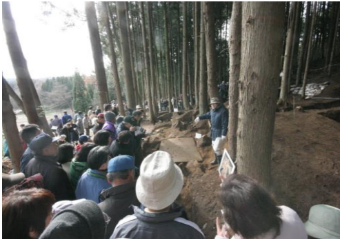
埋蔵文化財現地説明会の様子

市内の文化財を広く市民へ公開し、文化財保護精神の普及・啓発を図るため、白河市ではホームページで国・県・市指定の文化財を写真及び説明付きで分かりやすく紹