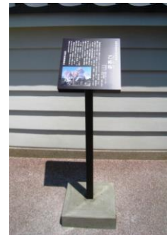
指定文化財説明板