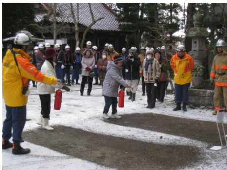
消火器による火災防御訓練

防災訓練については、文化財防火デーに併せ、火災防御訓練を実施している。実施にあたっては、各地域の建造物を中心とした指定文化財を対象に、市関係各課のほか、所有者・消防署・地元消防団・地元町内会等と連携を図りながら実施しており、地元住民が地域に残る貴重な文化財を自分たちで守っていく意識付けを行うとともに、消火器を使った火災防御訓練を実際に体験することで、火災防御のレベルアップを図っている。