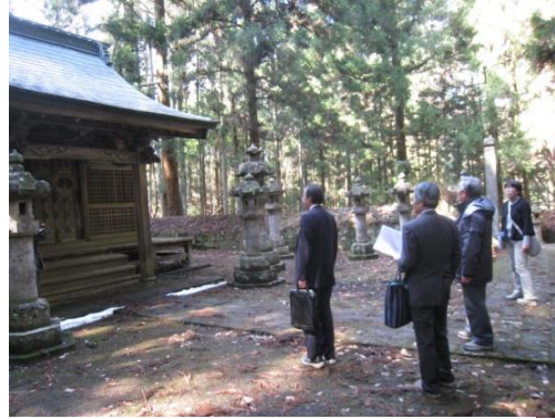
文化財保護審議会現地視察

白河市では、文化財の保存・活用に関する業務は、建設部都市政策室文化財課（文化財保護係・史跡整備係）の11人で担当している。事務所を歴史民俗資料館内に置き、収集資料内の文化財の保存・活用について、より密接に関わることができる体制となっている。また、白河集古苑の職員を文化財課職員が一部兼務しているため、集古苑所蔵の文化財の保存・管理について、速やかに対応できる体制となっている。