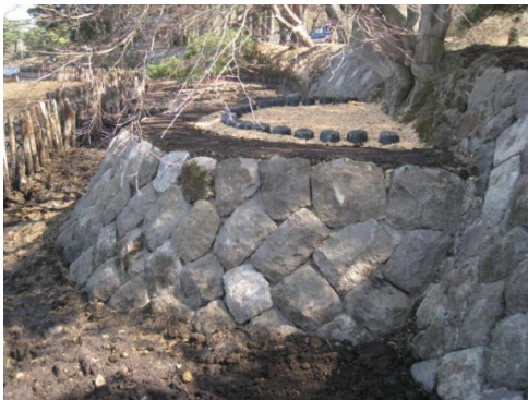
史跡及び名勝南湖公園の護岸整備

今後も、文化財の状況を常に把握した上で、法令に基づき適切な保存を図るとともに、計画的な修理・整備を行う。また、専門的な指導・助言を得ながら、文化財が持つ歴史的価値の保持に努めていく。