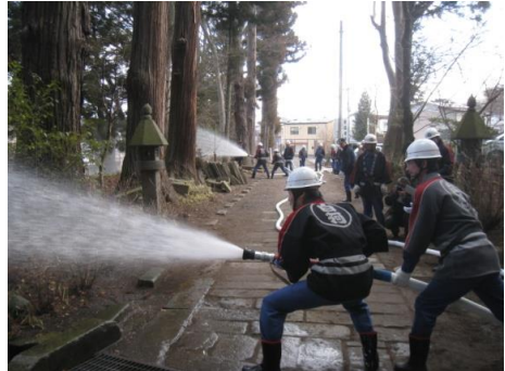
火災防御訓練の様子

文化財を災害から守り、後世に正しく引き継ぐためには、管理体制の整備が不可欠である。白河市では、「白河市地域防災計画」を定め、文化財管理者への指導として、定期的な防火診断の受診や自主的な点検の実施による火災発生の防止と火災原因の早期発見に努めることや、消火・警報設備の整備促進を図ることなどのほか、文化財保存施設の整備として、災害防止のため、耐火耐震の設備や施設の設置を推進している。現在のところ、消防法で義務付けられている重要文化財（建造物）はないが、火災発生の際、迅速に対応できるよう、義務付けられていない文化財についても自動火災報知器や消火器の設置を推進していく。特に初期消火の基本である消火器の設置については、建造物のみならず、重要文化財を所蔵している場所についても、補助制度等を活用しながら設置していくよう努める。