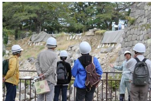
小峰城跡石垣修復箇所一般公開の様子

さらには、東日本大震災により崩落した小峰城跡の石垣修復に対する理解や関心を深めるため、工事の進捗状況や小峰城跡の様子などを定期的に一般公開している。