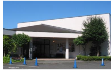
白河市歴史民俗資料館

文化財に関する案内・説明板等の設置については、「サイン統一計画」の策定に基づき色調やデザインの統一を図り、未設置箇所を中心に設置していく。