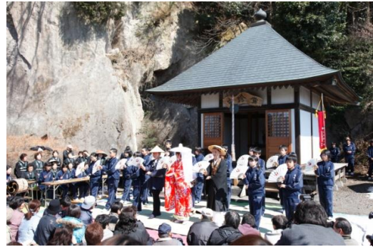
地域の民俗芸能を披露する中学生

介しているほか、すべての指定文化財への誘導・説明板の設置を進めている。また、埋蔵文化財発掘調査の現地説明会を開催しているほか、出前講座事業や各団体の学習会等に積極的に講師派遣を行うなど、文化財に対する知識・理解の高揚に努めている。さらに、文化財保護強調週間及び文化財防火デーに併せた文化財の公開等も実施している。