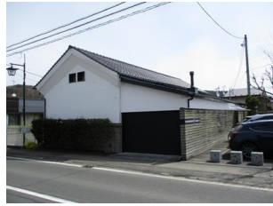
41.旧明治政府指定 米倉庫 (田町)