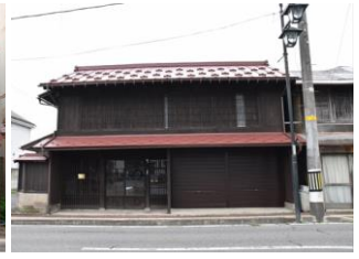
30.大崎家住宅建造物 (年貢町)