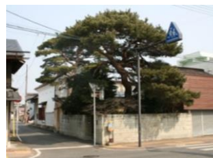
14.松河屋建造物群 (天神町)