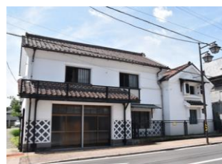
10.大谷家住宅建造物群 (中町)