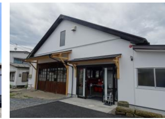
34.渡邊だるま店 だるま作業所 (横町)