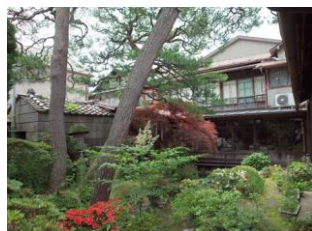
13.亀平商店建造物群 (本町)