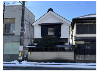
46.ヤマボシ醤油店 蔵座敷 (年貢町)

白河市では、白河市歴史的風致維持向上計画に基づき、「歴史的風致形成建造物」として44件101棟の建造物を指定（令和3年4月1日現在）し、保全活用を図っています。 これら建造物にみられる多様な建築様式は、城下町白河の街並みを特徴づける重要なもので、地域の歴史文化を活かした個性あるまちづくりを進めるための大きなヒントとなります。また、新築や改修などの際に、伝統的な建物などに使われている手法を取り入れることで、周辺の街並み景観と調和を図ることができます。 城下町の風情漂う建造物群を、「歴史の趣を伝える建造物」としてカタログにまとめました。皆さんの地域で行われる景観まちづくりにお役立てください。