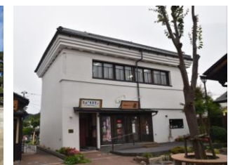
38.旧商工会議所建造物 (中町)