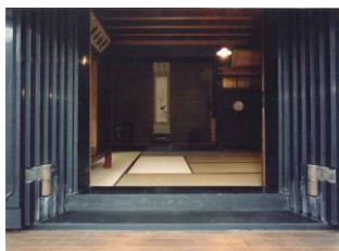
15.松島家蔵座敷建造物群 (旭町)