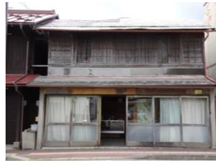
29.飯村家住宅建造物群 (年貢町)