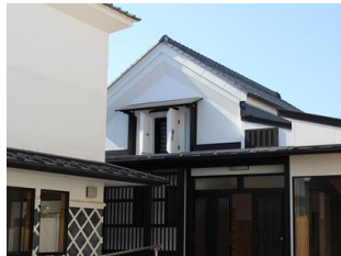
44.旧松井呉服店建造物 (天神町会館) (天神町)