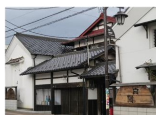
8.大谷忠吉本店 (白陽酒造)建造物群 (本町)