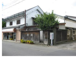
25.櫻井呉服店建造物群 (道場町)