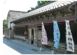
42.本家富川屋染物店 建造物群 (新蔵町)