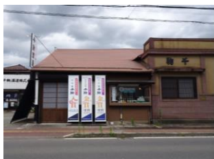
11.千駒酒造建造物群 (年貢町)