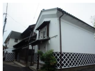
18.遠藤家住宅建造物群 (本町)