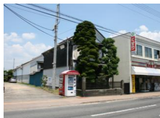
12.松井薬局建造物群 (天神町)