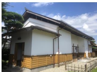
6.旧脇本陣柳屋旅館 建造物群 (本町)