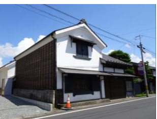
36.澤野家住宅建造物群 (道場小路)