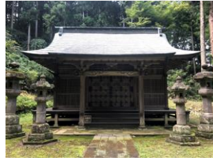
21.丹羽長重廟 (円明寺)