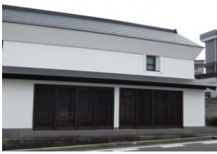
39.山崎家建造物 (旭町)