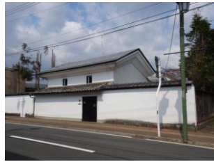
45.大木家住宅建造物群 (天神町)