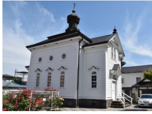
19.白河ハリストス正教会 (愛宕町)