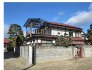
37.旧神齒科医院 (馬町裏)