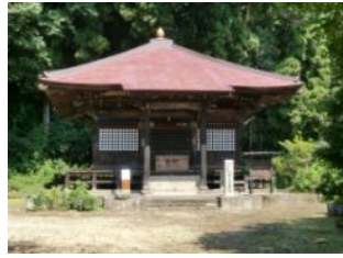
23.鹿嶋神社別当 最勝寺観音堂 (大鹿島)