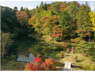
24.小南湖 (白河藩大名家墓所) (円明寺)