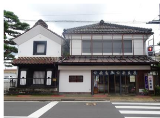
9.奈良屋呉服店 建造物群 (一番町)