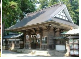
22.鹿嶋神社随身門 及び回廊 (大鹿島)