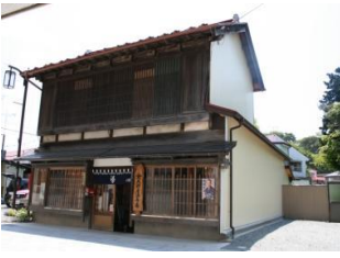
28.大野屋染物店建造物 (新蔵町)