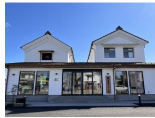
33.渡邊だるま店建造物群 (横町)