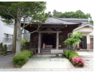
32.勝軍地蔵堂 (愛宕町)