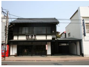
27.菓子舗玉家建造物 (本町)