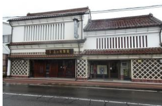
2.上の片野屋建造物群 (桜町)