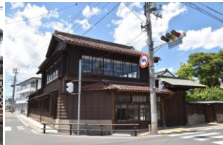
3.藤屋建造物群 (二番町)