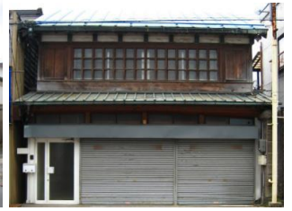
26.根本家住宅建造物群 (本町)