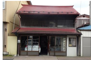
5.仁平麴店建造物群 (天神町)