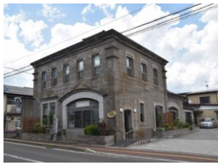
31.長田美容院建造物群 (年貢町)