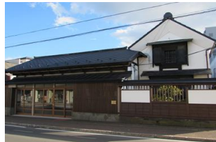
4.今井醤油店建造物群 (天神町)