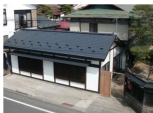
16.会津屋建造物群 (旭町)