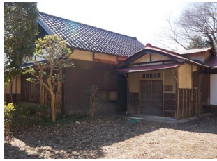
40.旧小峰城太鼓櫓及び 旧荒井家「楽山荘」 (郭内)