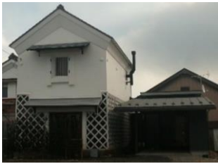
43.河和家住宅建造物 (横町)