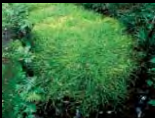
不動清水のビャッコイ

表郷地域の清水流中にのみ自生する水草。氷河期の名残をとどめる神秘的な植物で、このほかには世界でもスウェーデンでしか見られない大変貴重な多年草です。茎は細く、横に這うように枝を伸ばすビャッコイは、水がきれいな湧水口の水温が一定のところしか自生できないといわれ、表郷地域の中でも金山・瀬戸原地内のみで生息しています。