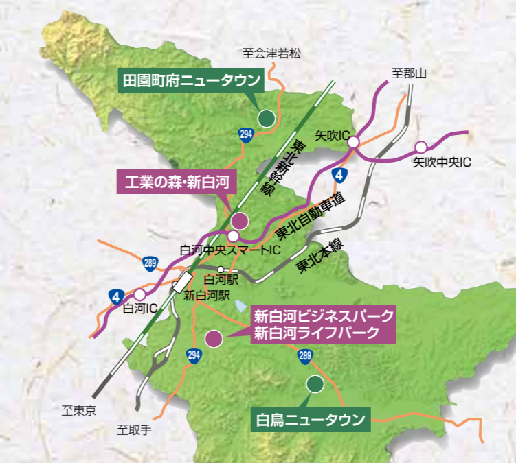
小峰城 ※現在、石垣修復中