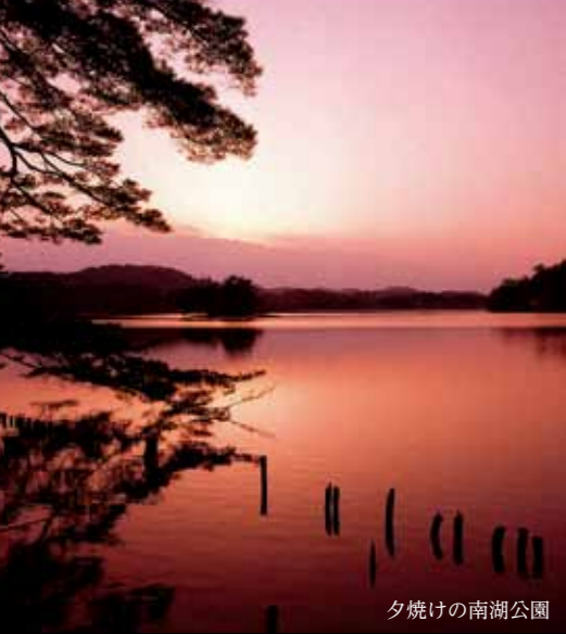
夕焼けの南湖公園