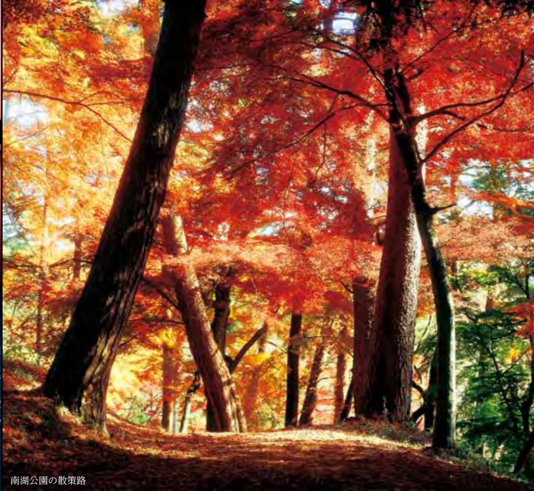
南湖公園の散策路