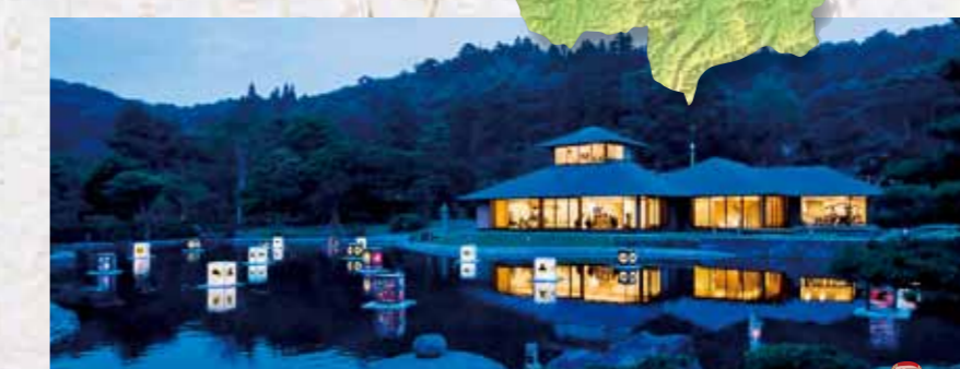
工業の森・新白河