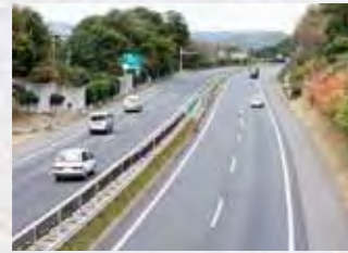
東北自動車道・白河中央スマートIC 高速アクセスで全国へ

新白河駅から東京駅まで最速で71分。たとえば、白河の工場から東京のオフィスまで約2時間で移動できるので、本社出張も余裕で日帰りができます。首都圏とのアクセスの良さが魅力です。