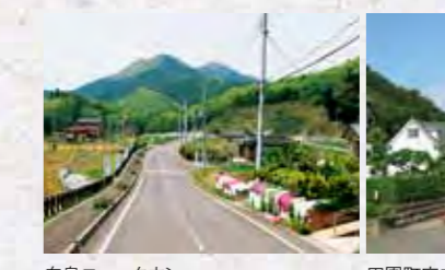
白鳥ニュータウン

白河市には、本当の意味で満たされる豊かな暮らしがあります。白鳥ニュータウン(表郷地域)、田園町ニュータウン(大信地域)は、おいしい水と生活に便利な施設がすぐそばにある快適な生活空間。ここでは、野菜づくり、ガーデニング、ゴルフ、スキー、温泉などを楽しみながら、快適な生活を存分に味わうことができます。