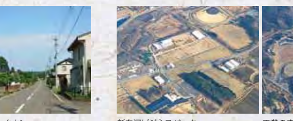
新白河ビジネスパーク

古来より要衝の地として歴史の舞台に登場する本市は、東京から200km圏内に位置し、東北自動車道や東北新幹線などの高速交通網が整備され、利便性に優れていることに加え、地盤が固く安全性の高い企業活動に適した地域です。生産拠点である「工業の森・新白河」や研究開発拠点「新白河ビジネスパーク」では多くの企業が進出し、快適な生活空間「新白河ライフパーク」では住宅の集積が進むなど、職・住・悠を備えた魅力ある場を提供しています。