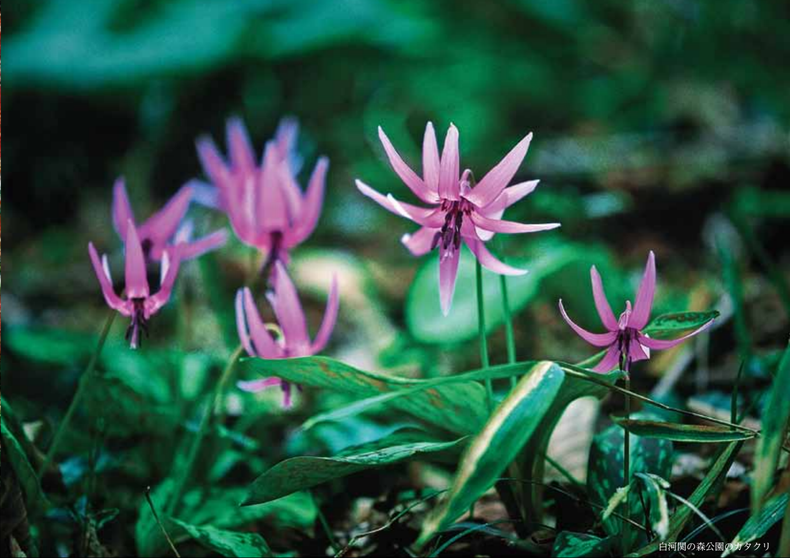
白河関の森公園のカタクリ