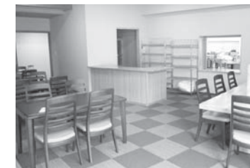
お食事処「きつねっこん」