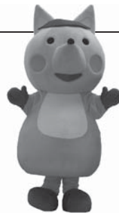
きつねうち温泉キャラクター「きつねっこん」

〒987-0801 福島県いわき市(きつねうち温泉内) ☎0246-81-1126