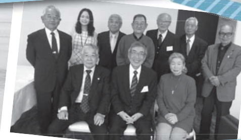
ふるさとへの思いを語り合う 平成26年度東京おもてごう会役員会 3月7日 / 東海大学校友会館 (東京都千代田区)