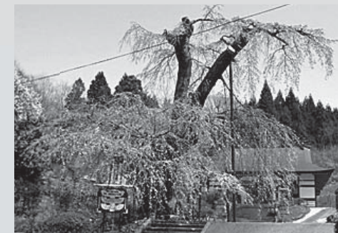
■満徳寺の桜 (東上野出島)