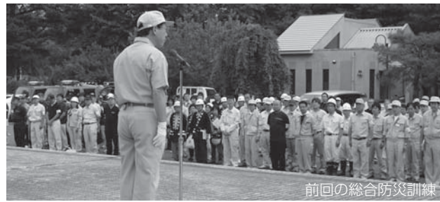
前回の総合防災訓練