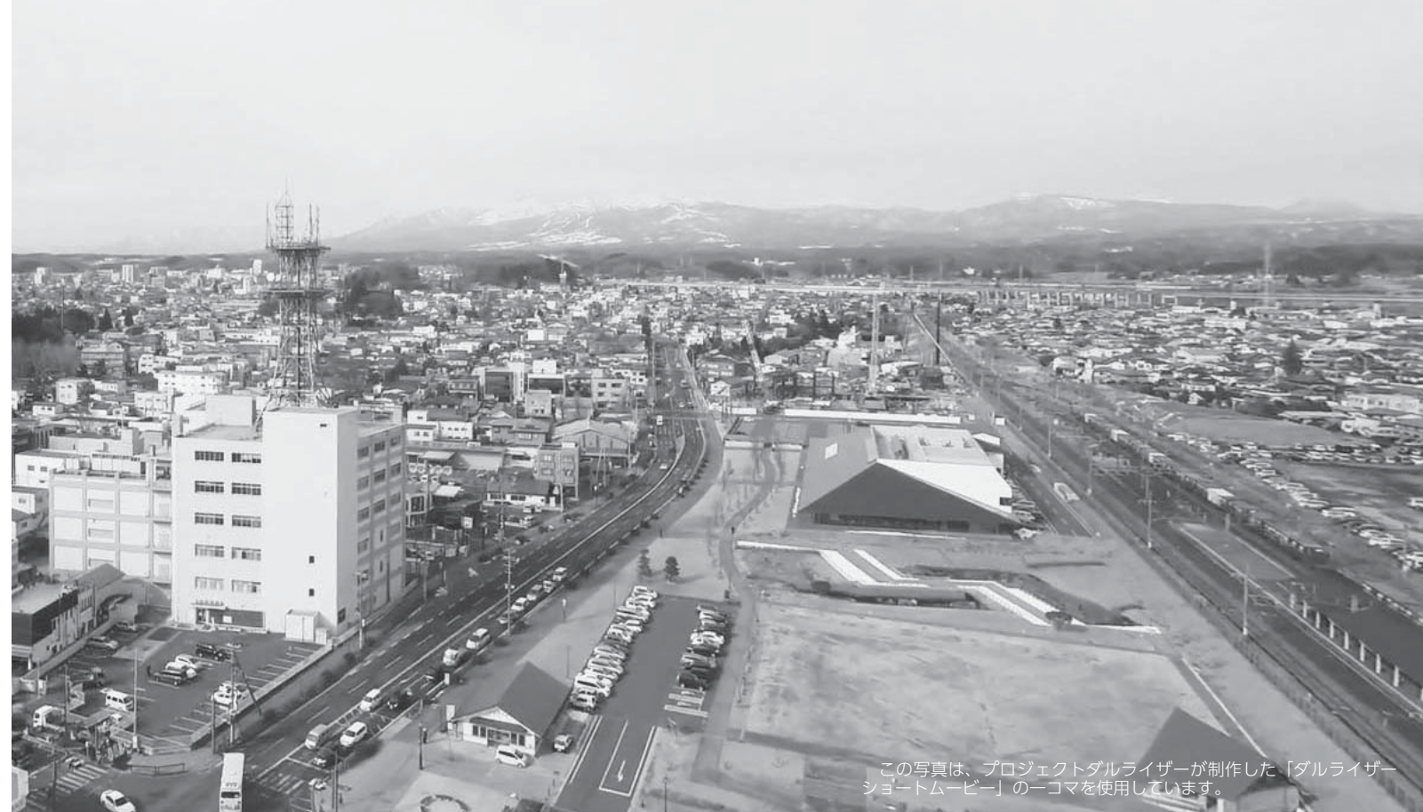
この写真は、プロジェクトダライザーが制作した「ダライザー ショートムービー」の一コマを使用しています。