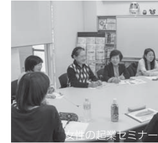
女性の起業セミナー