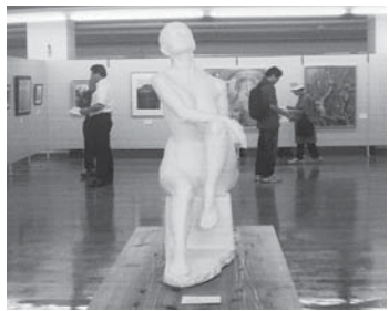
▲白河美術協会主催「第40回白河美術協会展」