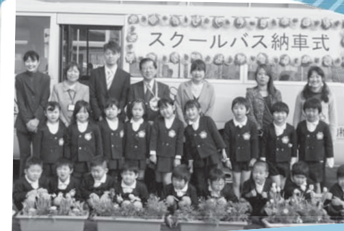
早く新しいバスに乗りたないな! 大信幼稚園スクールバス納車式 3月5日 / 大信幼稚園 (大信町屋)