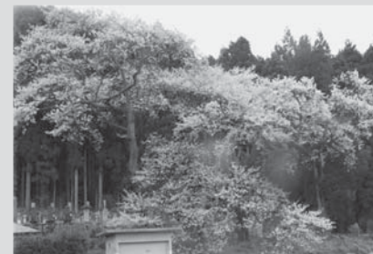
■町屋の江戸彼岸桜 (大信町屋)