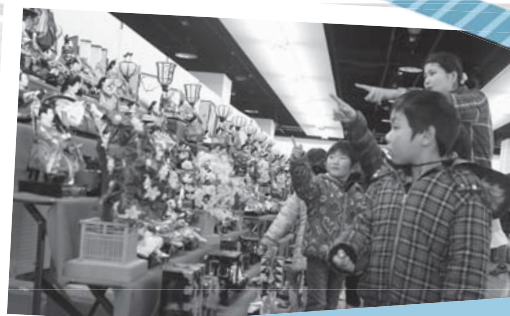
きれいなおひな様がいっぱい♪ 城下町白河おひな様めぐり 3月3日 / マイタウン白河 (本町)