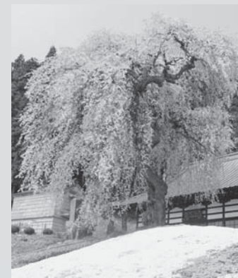
■松雲寺観音しだれ桜 (舟田)

市内には桜の名所がたくさんあります。ぜひ、足を運んでそれぞれの桜の美しさを堪能してください。