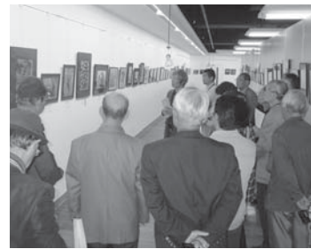
▲市総合美術展覧会実行委員会主催「第60回総合美術展覧会」