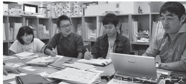
コミュニティスペース