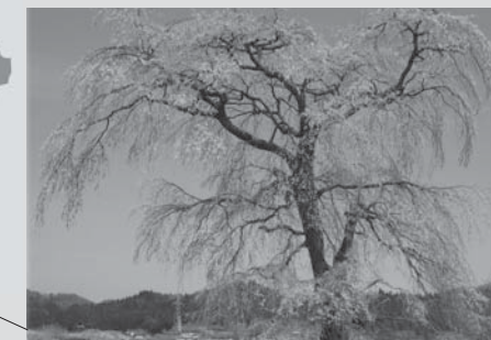
■高萩の桜 (表郷社田)