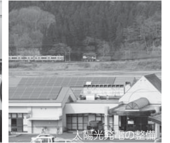
太陽光発電の整備