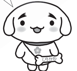
市公認キャラクター「しらわん」