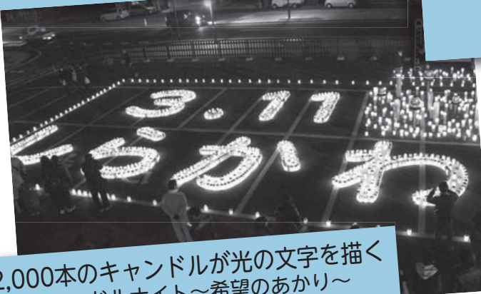
2,000本のキャンドルが光の文字を描く キャンドルナイト〜希望のあかり〜 3月11日 / 市民会館駐車場 (手代町)