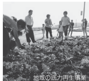
地域の底力再生事業