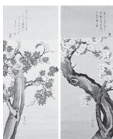
谷文晁「桜・紅葉図」

◇結城家古文書館 「重要文化財 白河結城家文書と中世の美術」 ミニテーマ展「江戸時代の結城家-結城家のその後-」開催中