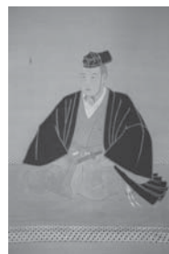
長谷川周春「松平定信像」 (5月24日まで展示)