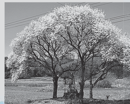
■庄司戻しの桜 (表郷中野)