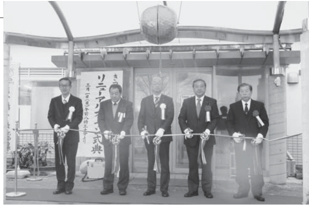
▲テープカットに臨む関係者

3月1日、きつねうち温泉健康館（東釜子）で、施設のリニューアルオープンセレモニーが行われ、関係者がテープカットやくす玉でオープンを祝いました。続いて行われた記念イベントでは、ダブルダッチ（2本のロープを使う縄跳び）のプロチーム「カプリオール」によるパフォーマンスや、みちのくボンガーズのお笑いライブが繰り広げられました。また、しらかわんやきつねっこんなどご当地キャラが登場し、大勢の来館者は楽しいひとときを過ごしました。