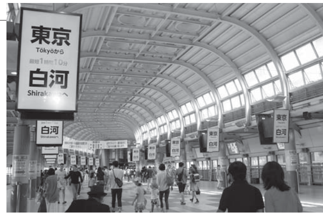
▲観光CMが放映された品川駅構内

8月31日から9月6日までの7日間、品川駅構内で「白河市観光プロモーション」として、自由通路に設置されている44面の大型ディスプレイに、公認キャラのダルライザー、小峰シロ、しらかわんが出演する観光CMを放映し、PRを行いました。9月5日・6日には、駅構内のイベント会場で、観光DVDの放映や観光アプリの体験、特産物のプレゼントが行われました。また、会場にダルライザーとしらかわんが登場し、多くの人を喜ばせました。