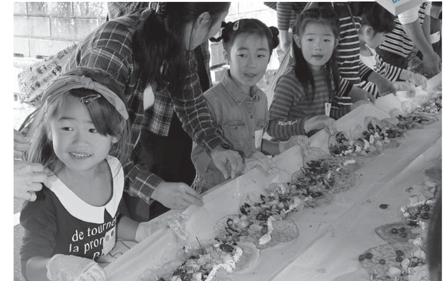
▲一斉にクレープを巻く子どもたち