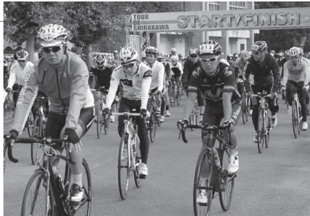
▲スタートする参加者

約500人の参加者は、東風の台運動公園をスタート・ゴールとする103kmのコースを、それぞれのペースで走りました。コースの途中では、ご当地キャラが出迎え、地域の産品などが提供されました。