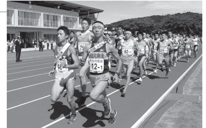
▲競技場をスタートする選手たち

また、競技にあわせ、まちなかでは「にぎわいイベント2015」が開催され、来場者がダンスを楽しむなど、駅伝観戦とともにイベントを満喫していました。