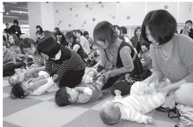
▲親子で楽しくスキンシップ

12月11日、マイタウン白河（本町）で、「おひさまひろばクリスマス会」が開かれました。おひさまひろばでは、会員の皆さんにクリスマス気分を親子で楽しむのもうらため、毎年開催しています。 会では、50組の親子が手遊びや簡単な運動でスキンシップをしたり、スタッフとボランティアがハンドベル演奏や人形劇を披露したりして、子どもたちを楽しませました。また、サンタクロースも登場し、満面の笑顔で喜ぶ子どもたちの姿が見られました。