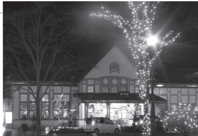
▲白河駅前で輝くイルミネーション

12月19日、JR白河駅前イベント広場で、イルミネーションの点灯式が行われました。 市中心市街地活性化協議会が様々な団体の協力を得て、今年は白河駅前から市立図書館（道場小路）までイルミネーションの規模を拡大しました。関係者がスイッチを押すと、約2万灯の電飾が一斉に点灯し、集まった人々から歓声があがりました。 イルミネーションの点灯は、2月11日まで実施しています。