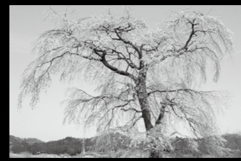
■高萩の桜 (表郷社田)