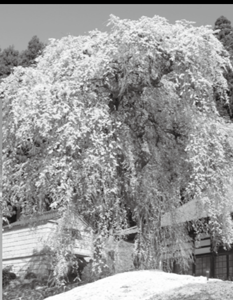
■松雲寺観音しだれ桜 (舟田)