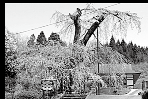
■満徳寺の桜 (東上野出島)