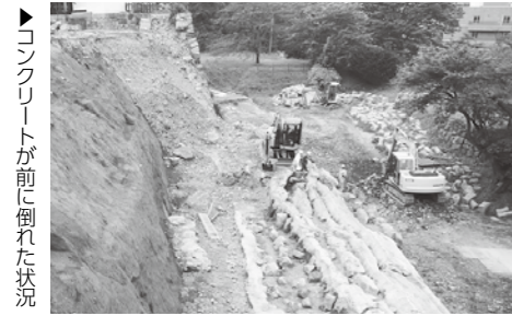
▶コンクリートが前に倒れた状況 ▶本丸跡の盛土状況