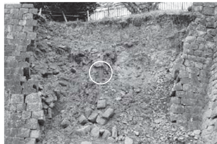
崩落後の状況（中央の鋼矢板より左側が修復された）