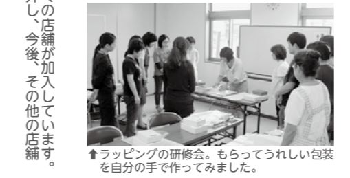
↑ラッピングの研修会。もらってうれしい包装を自分の手で作ってみました。