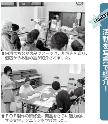
↑白河まちなか逸品ツアーでは、加盟店を巡り、個店からお勧め品が紹介されました。