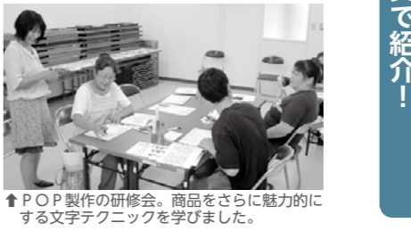
↑POP製作の研修会。商品をさらに魅力的にする文字テクニックを学びました。