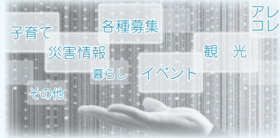
▲発信する情報（イメージ）

FBの特徴を有効に活用し、よりリアルタイムな情報の発信に努めます。今後、本市の様々な魅力や暮らしの情報を発信し、双方向性を生かして本市のファンの増加を目指します。市公式ページは、市ホームページから見ることが出来ます。 ▷ http://www.city.shirakawa.fukushima.jp/