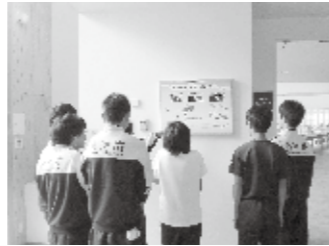
▲太陽光発電パネルに見入る生徒