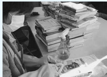
◀ボランティア作業の様子

11月11日から12月末にかけて、30人近いボランティアの方々にお手伝いをいただき、ビニールコートされた本を専用の洗浄液で一冊一冊丁寧に拭いていただきました。新館では、きれいになった本が並びますのでご期待ください。