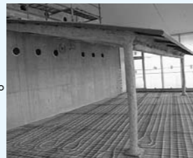
▲おはなしのこや 屋根がつき、現在は床の工事がされています。 ここに床暖房が入ります。