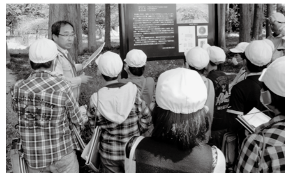
▲「借宿庵寺跡」等の見学(6年生) 文化財課の職員が説明してくれました。

五箇地区は昔から米作りが盛んです。また、「下総塚古墳」「舟田中道遺跡」「借宿庵寺跡」等の遺跡があります。社会科の時間や総合的な学習の時間には、市文化財課の方と一緒に、地区にある史跡へ出掛けていって学習しています。昨年度は発掘調査にも参加しました。こうした地域の良さを授業に生かすことによって地域に誇りと愛着を持ってほしいと思っています。