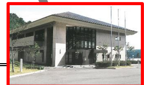
水道部下水道課 市環境センター