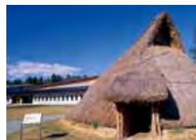
福島県文化センター白河館・まほろん

南湖公園の一角にある日本庭園。松平定信の庭園思想を体現した苑内には呈茶が楽しめる松楽亭等、茶室もあります。