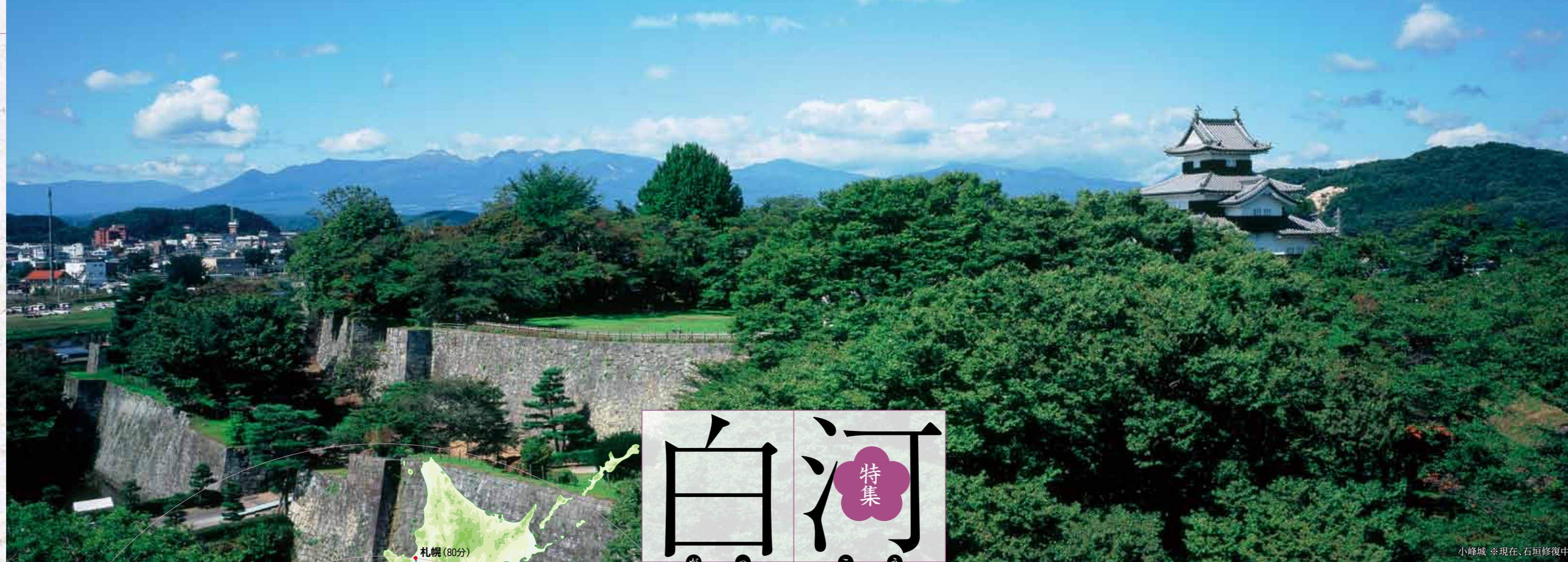
小峰城 ※現在、石垣修復中