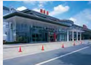
福島空港 全国主要都市、そして海外へ

東北自動車道を利用すれば、白河中央スマートICから浦和ICまで1時間44分ほどで首都圏に直結。磐越自動車道と北陸自動車道を経由すると、関西圏にも迅速にアクセスすることが可能です。