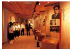
中山義秀記念文学館

白河市大信にあるキャンプ場。バンガローや遊歩道も整備されており、隈戸川の源流の美しさも魅力です。