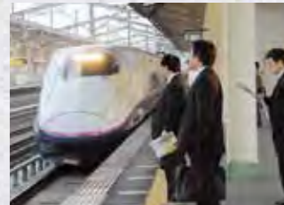
東北新幹線・新白河駅 最速71分で東京へ

白河は高速交通体系に恵まれており、アクセスの良さは、ビジネス・レジャーに魅力的です。