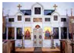
白河ハリストス正教会

白河市街の東方の丘陵にある城跡。鎌倉から室町時代に白河周辺を領した白河結城氏がこの地を本拠地に活躍しました。