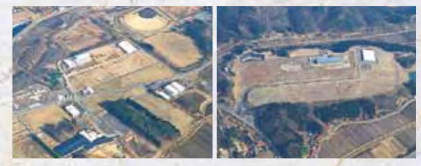
新白河ビジネスパーク 工業の森・新白河

古来より要衝の地として歴史の舞台上で登場する本市は、東京から200km圏内に位置し、東北自動車道や東北新幹線などの高速交通網が整備され、利便性に優れていることに加え、地盤が固く安全性の高い企業活動に適した地域です。生産拠点である「工業の森・新白河」や研究開発拠点「新白河ビジネスパーク」では多くの企業が進出し、快適な生活空間「新白河ライフパーク」では住宅の集積が進むなど、職・住・悠を備えた魅力ある場を提供しています。