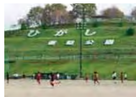
東風の台運動公園

約4,000㎡の芝生広場には、鶴をイメージした大型コンビネーション遊具があり、30mのローラーすべり台やブランコなど、様々な遊びが楽しめます。