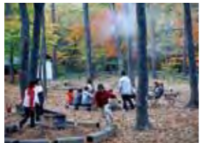
聖ヶ岩ふるさとの森

白河市の最高峰・権太倉山(976m)の麓にある巨石で、源義経の愛馬にまつわる伝説があります。