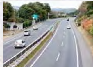
東北自動車道・白河中央スマートIC 高速アクセスで全国へ

新白河駅から東京駅まで最速で71分。たとえば、白河の工場から東京のオフィスまで約2時間で移動できるので、本社出張も余裕で日帰りができます。首都圏とのアクセスの良さが魅力です。