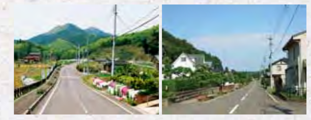
白鳥ニュータウン 田園町ニュータウン

白河市には、本当の意味で満たされる豊かな暮らしがあります。白鳥ニュータウン(表郷地域)、田園町ニュータウン(大信地域)は、おいしい水と生活に便利な施設がすぐそばにある快適な生活空間。ここでは、野菜づくり、ガーデニング、ゴルフ、スキー、温泉などを楽しみながら、快適な生活を存分に味わうことができます。